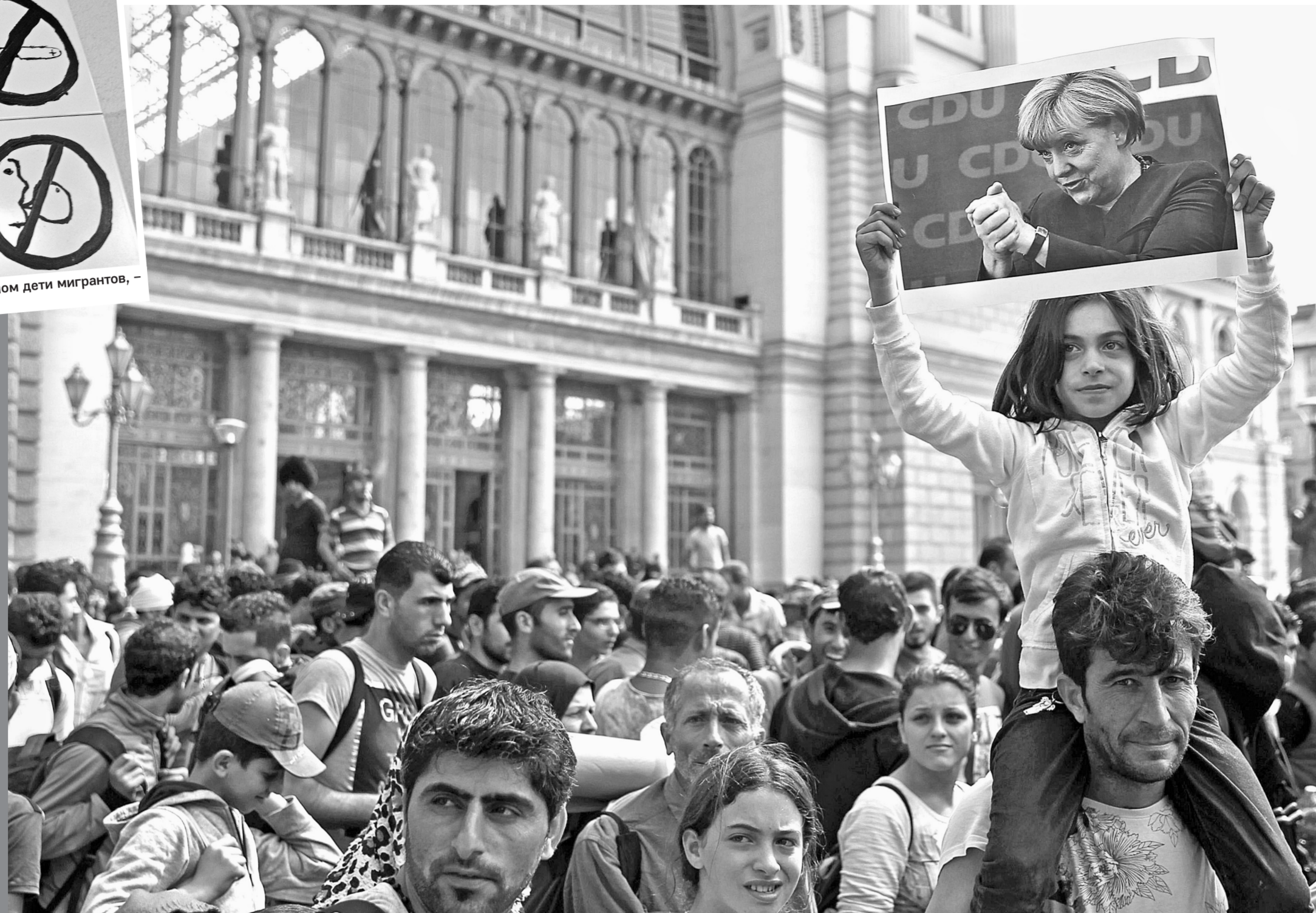
Канцлер Германии Меркель своим «мы справимся» обнадежила мигрантов

Германия ещё не определилась, нужны ли ей мигранты