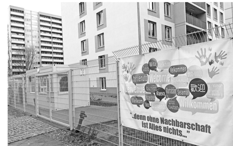
Вокруг общежития для мигрантов – забор с пунктом охраны. И надписи «Добро пожаловать!» на многих языках

Интеграция – процесс тяжёлый, длительный и болезненный. Это в некотором смысле инвестиции в отдалённое будущее, которые требуют определённых жертв в настоящем