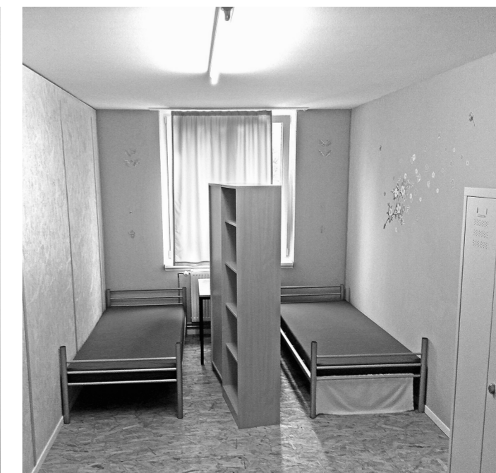
Обстановка в комнатах мигрантов аскетичная. Главное здесь – функциональность, а не эстетика