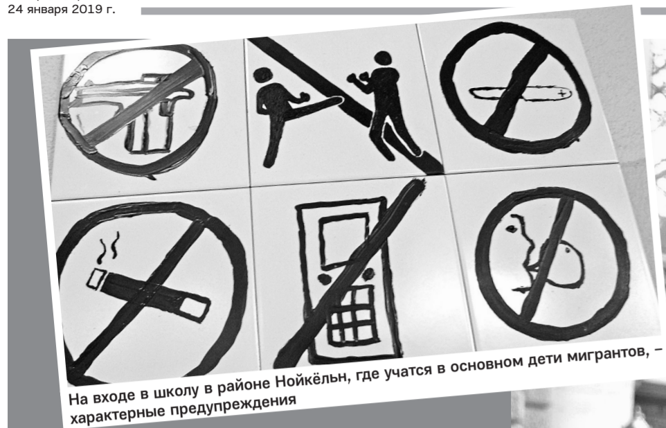
На входе в школу в районе Нойкёльн, где учатся в основном дети мигрантов, – характерные предупреждения