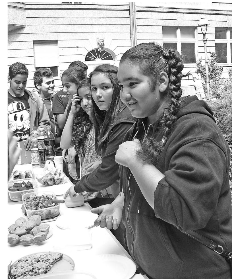
Школьницы из семей мигрантов проводят распродажу национальных сладостей, которые выпекли дома. Берлин, район Нойкёльн

Я промолчал. Молчание – далеко не всегда знак согласия. БП