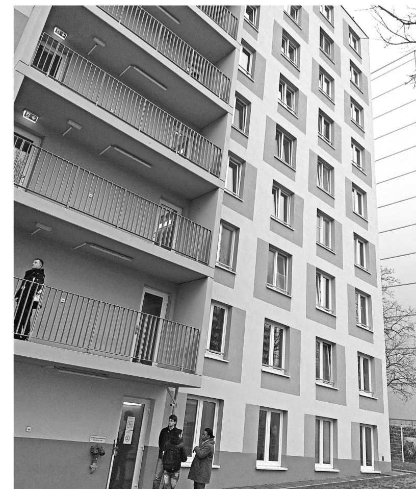
Это девятиэтажное здание построено в Берлине специально для мигрантов