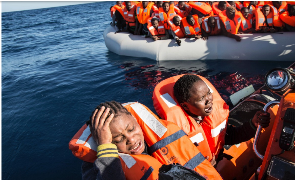
Беженцы на переполненной резиновой лодке пересекают Средиземное море.