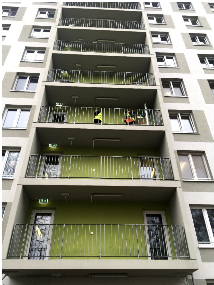
Центр размещения беженцев в Берлине

Персонал показывает пустые комнаты, предназначенные для проживания двух-трех человек - семейных и одиночек, общие кухни и санузлы. Во всем - образцовый порядок, отсутствие домашнего уюта. Здесь живут 230 беженцев из Сирии, Ирака, Афганистана, Эритреи, Центральной Африканской республики, Сербии, в последнее время увеличилось число украинцев.