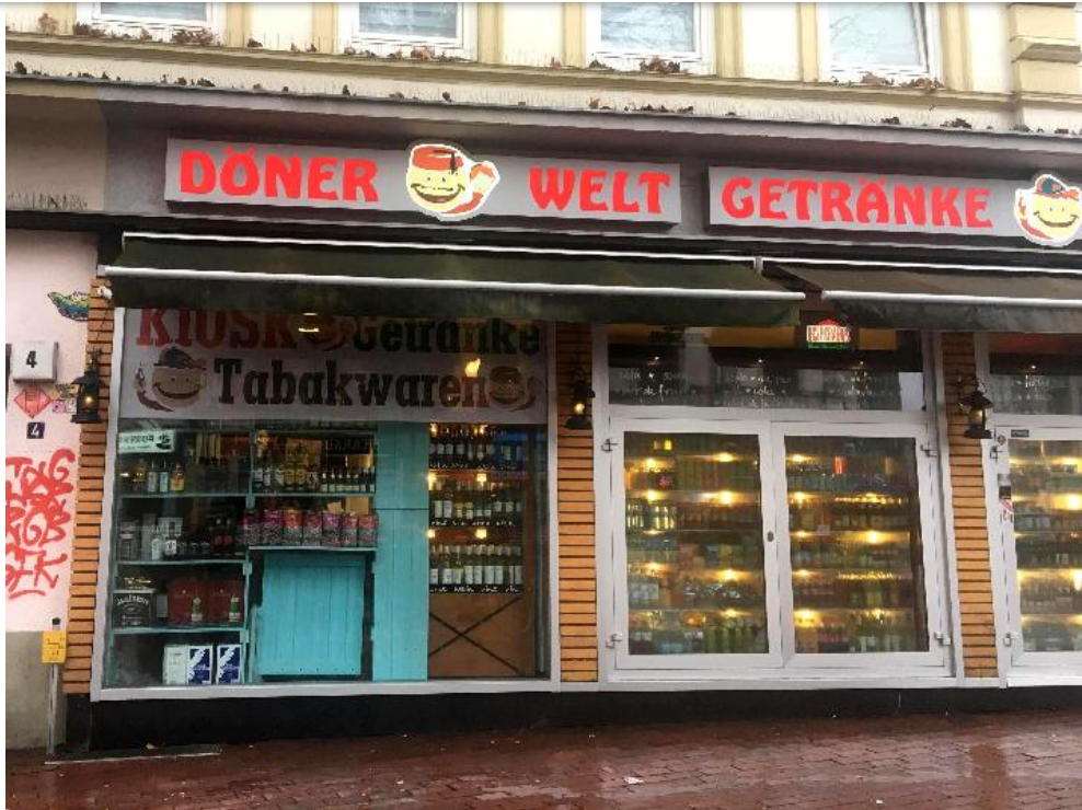
Точка продажи турецкого фастфуда в Германии