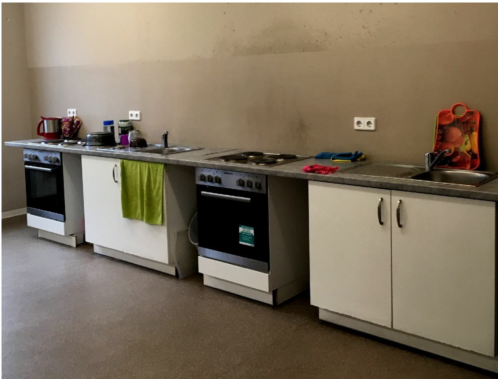
Центр размещения беженцев. Комнаты

Затраты на пребывание каждого беженца (питание, медикаменты, коммунальные услуги, обслуживание) в центре оценить сложно, в среднем 400-600 евро. На карманные расходы каждый соискатель убежища получает 134 евро. В свою очередь, уже покинувшим общежитие полагается по 354 евро в месяц.