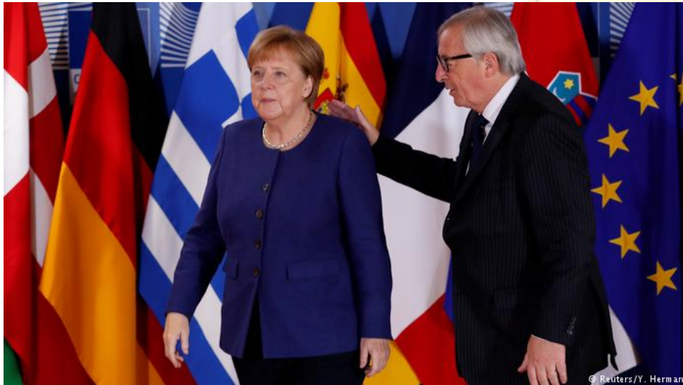
Ангела Меркель и глава Еврокомиссии Жан-Клод Юнкер на саммите ЕС, 24 июня 2018 года.

На саммите в Брюсселе в июне 2018 года члены Евросоюза приняли решение отказаться от политики открытых границ. Беженцев решено сдерживать в специальных лагерях за пределами Евросоюза. Германия ранее, еще в 2016 году, заключила соглашение с Турцией, согласно которому турецкие власти будут строго держать свои границы и получат три миллиарда евро от ЕС на содержание беженцев в лагерях. В конце прошлого года германские власти ужесточили процедуру получения убежища, вплоть до перепроверки ранее поданных прошений. Лицам, получившим отказ в убежище, выделяется пособие на возвращение домой. Вместе с этим, депутаты прояснили условия пребывания для трудовых мигрантов, которых в ФРГ хотят четко отделить от беженцев и способствовать их прибытию (для них пособие не предусмотрено).