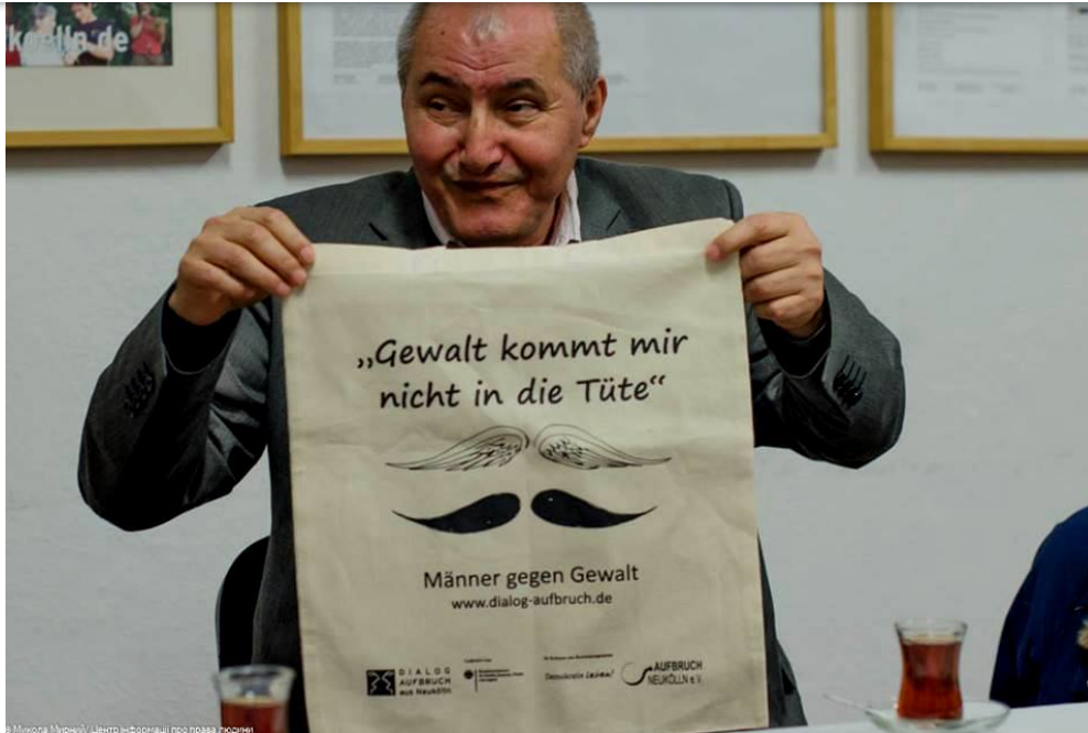
Казим Эрдоган.