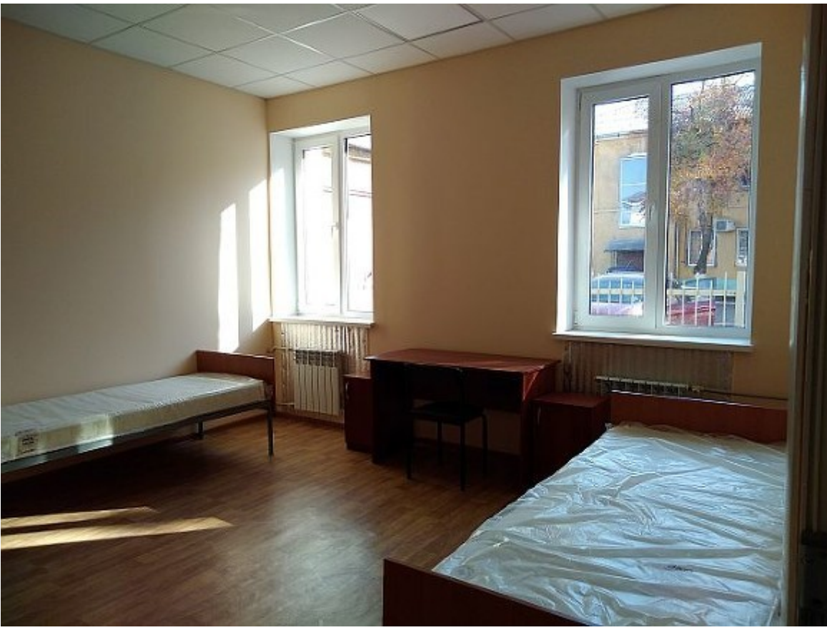
Kramatorsk köçkünlər yataqxanası

“Digər məsələ işsizliklə bağlıdır” – İ. Siedova davam edir – “Bir çoxu Ukraynanın şərqindən gələnlərə kirayə ev vermək istəmir. Çünki qorxurlar seperatist olsun. Ukraynada məcburi köçkünlər üçün kifayət qədər yataqxanalar tikilməyib. Onlara verilən yardım isə olduqca azdır”.